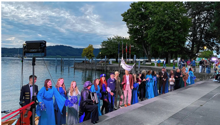
Im Hafen endet die Kulturexpedition unter großem Beifall des Publikums.